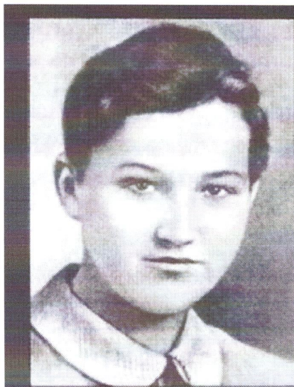
З. А. Космодемьянская

("Женщины в годы Великой Отечественной войны" в рамках творческой патриотической акции, посвященной Великой Победе")